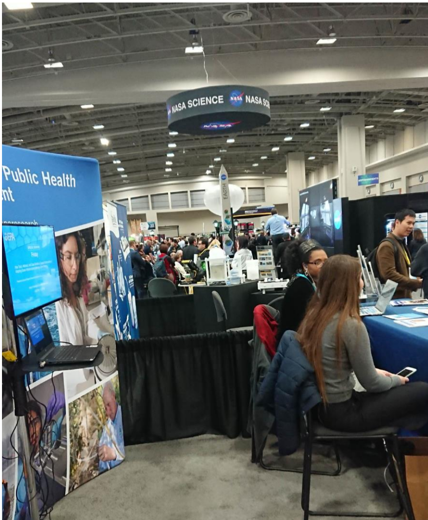
↑ 展覽廳內，NASA 攤位 人潮眾多