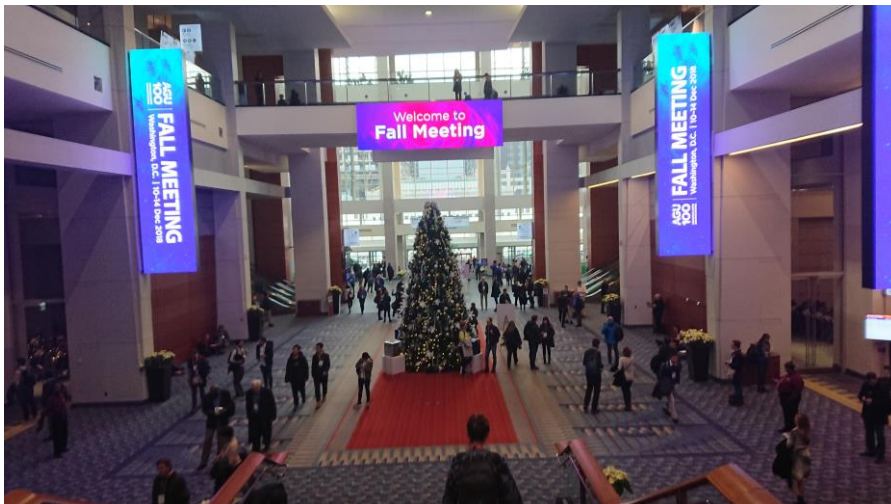
會場內的聖誕樹與人潮

我覺得官方利用手機 APP 的方便性取代需要大量花費的秩序冊，既環保又省經費，且手機 APP 可於未來會議繼續使用，並不像傳統的紙張，一年會議結束就只能當紀念。在會議下午有發放免費啤酒，我認為還是發放不含酒精的飲料就可以了。