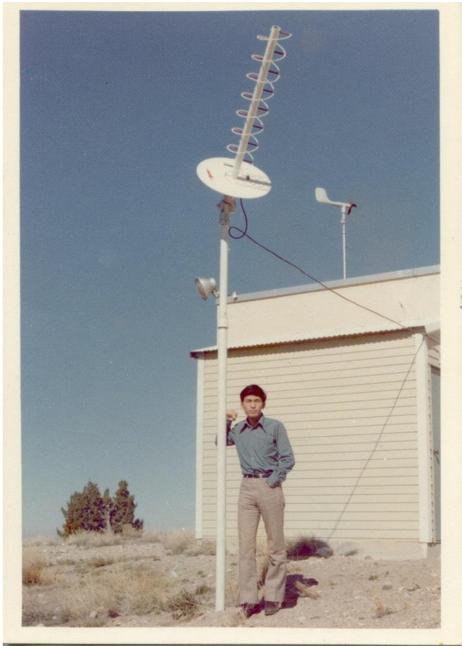
Seismic Research Observatory (SRO)