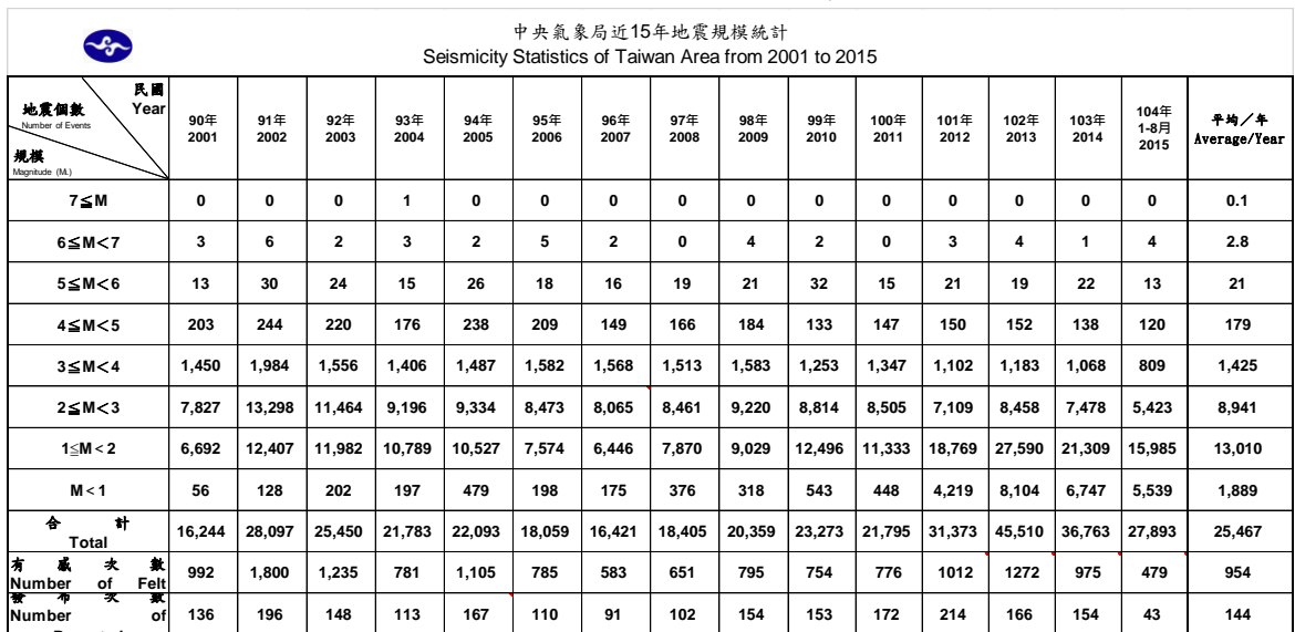
表 2. 中央氣象局近 15 年地震個數與規模統計表