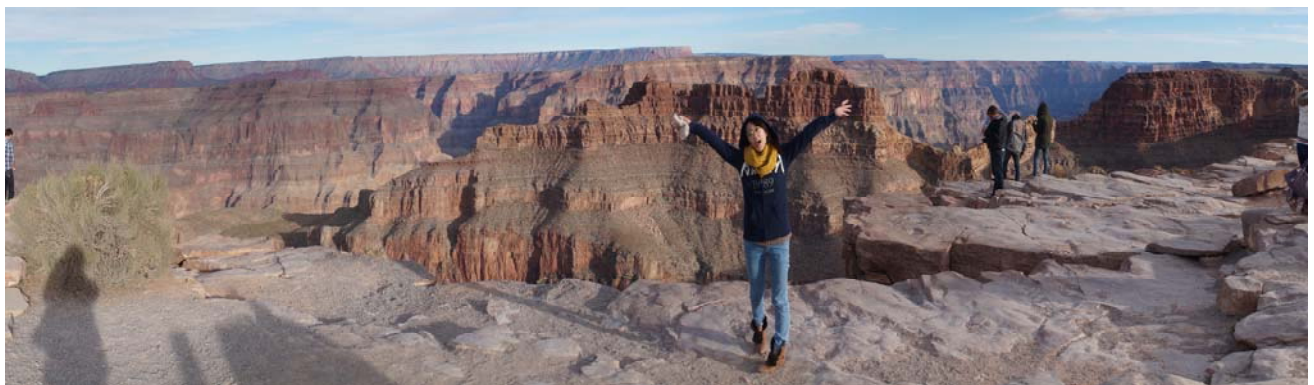
自行安排的野外考察活動-大峽谷