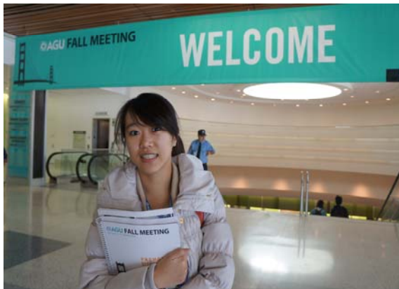
2012 AGU FALL MEETING 會場