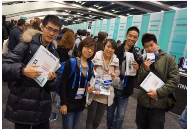
領取會員證及摘要論文集